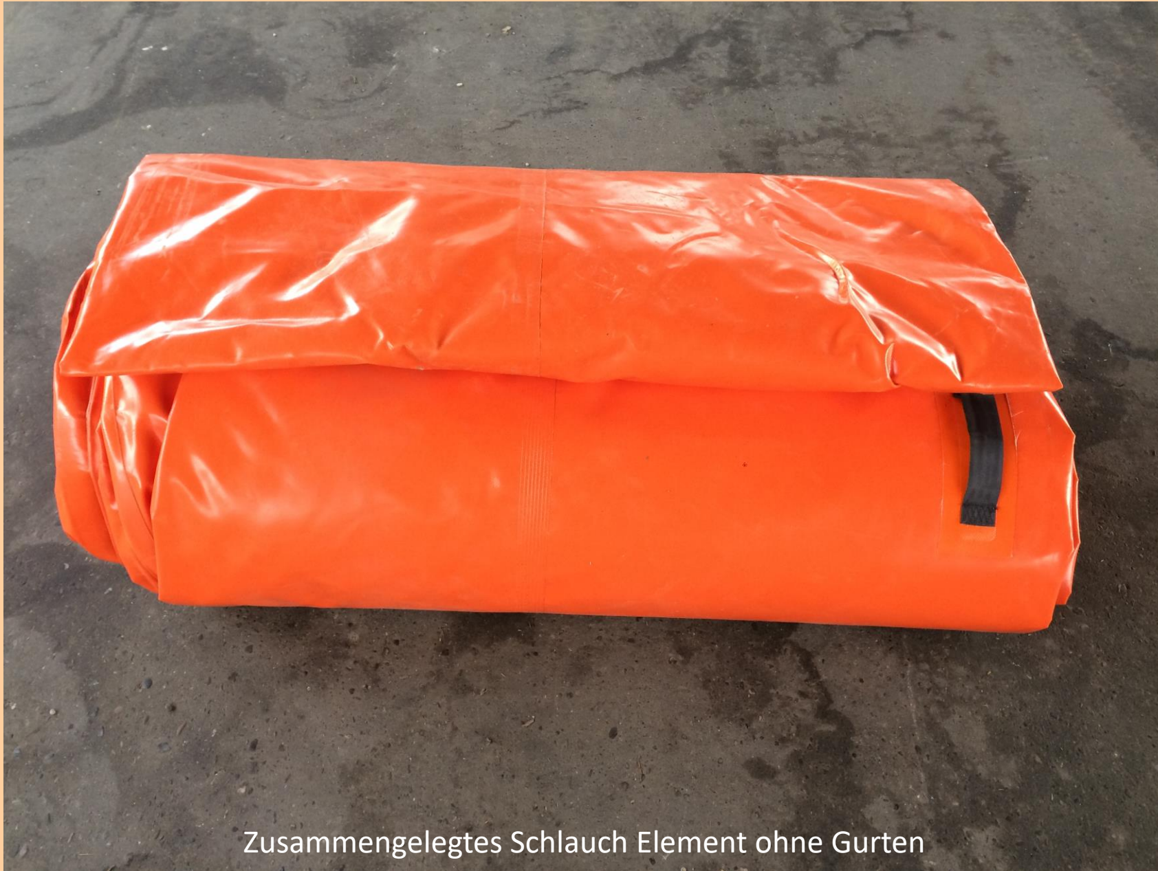
Zusammengelegtes Schlauch Element ohne Gurten