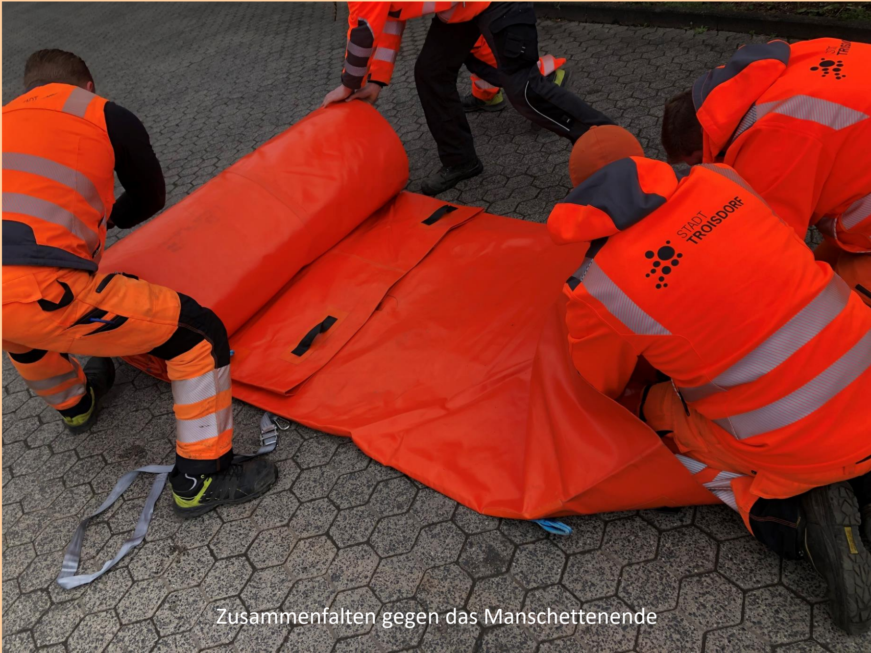
Zusammenfalten gegen das Manschettenende