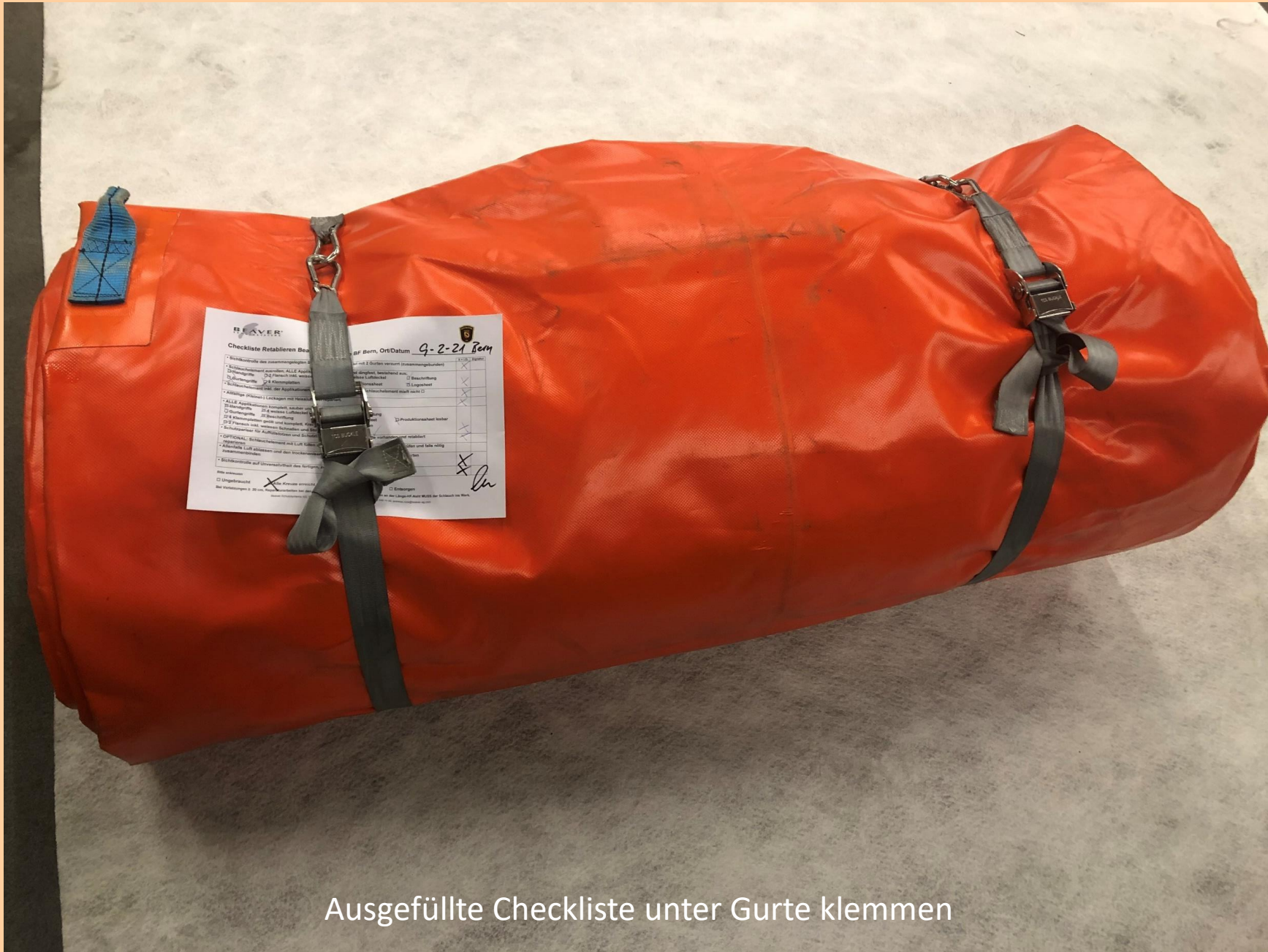
Ausgefüllte Checkliste unter Gurte klemmen