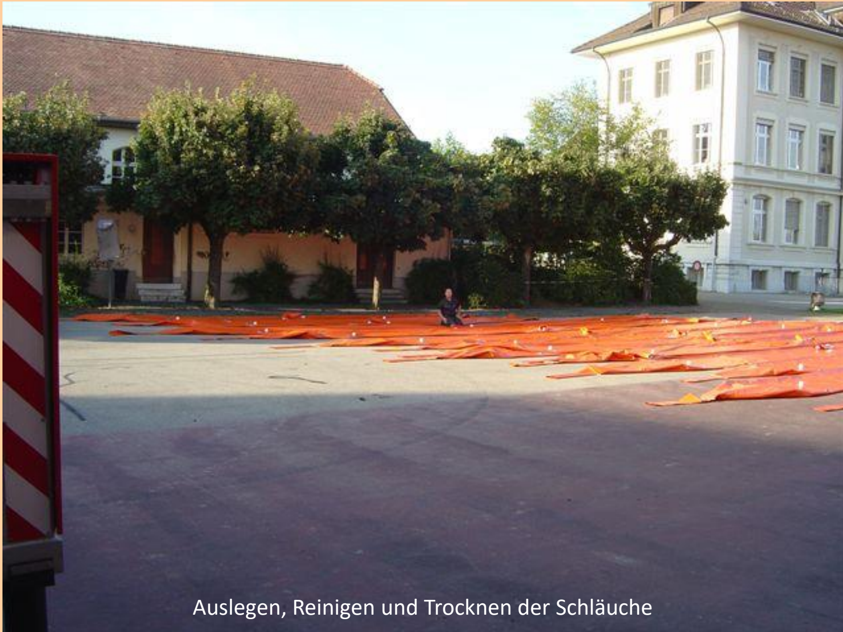
Auslegen, Reinigen und Trocknen der Schläuche