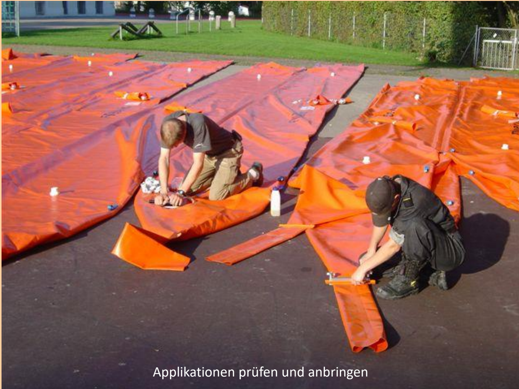
Applikationen prüfen und anbringen