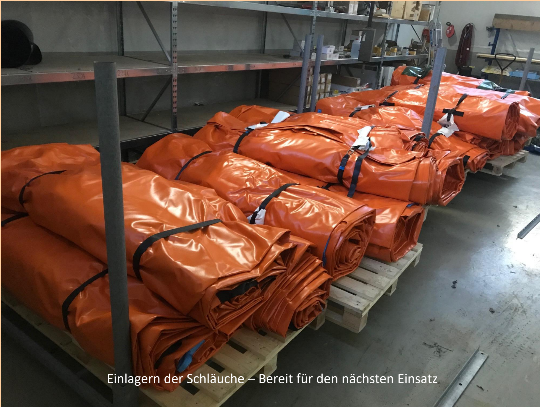
Einlagern der Schläuche – Bereit für den nächsten Einsatz